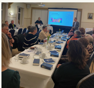
Billede fra repræsentantskabsmøde i 2024